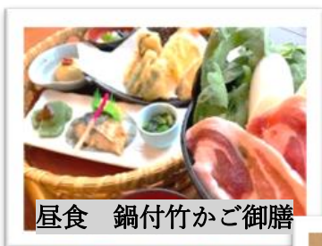
昼食 鍋付竹かご御膳