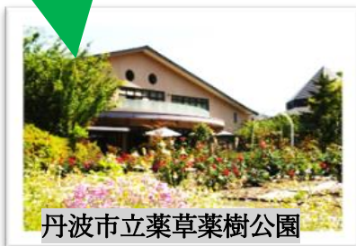
丹波市立薬草薬樹公園